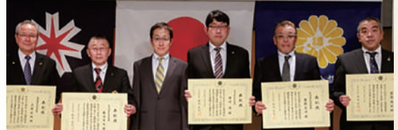
調理師功績表彰式典 主催/一般社団法人北海道全調理師会 後援/北海道 北海道保健福祉部健康安全局長 古郡修様より表彰