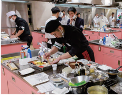
調理技能コンクールの様子