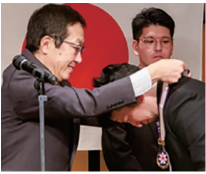
受賞者には知事よりメダルを贈呈

本日、札幌ベルエポック製菓調理専門学校のご協力のもと一般社団法人北海道全調理師会主催の第58回調理技能コンクールを滞りなく開催いたしました事をここに報告申し上げます。このコンクールは選手それぞれが地域・職域において日常の業務を通じ修得した知識と技術の成果を発表する場として、更には参観する会員に技術を普及し、調理師の資質の向上に役立てるとともに道民の食生活向上に寄与することを目的としたコンクールでございます。