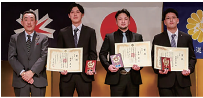
金賞を受賞された3部門の皆さんと小泉理事長